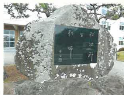
われいがいみなわがし 校碑:「我以外皆我師」